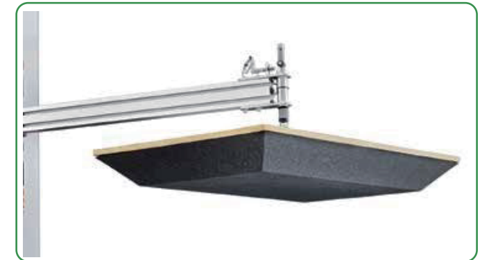
天面荷崩れ抑制ユニット